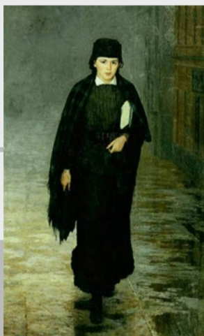
Курсистка. Худ. Н.А. Ярошенко. 1883.